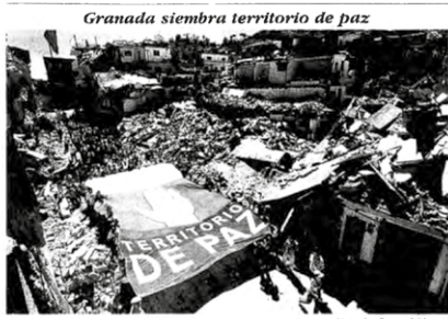
Las hecatombas de Granada, población del Departamento de Antioquia, que quedó casi destruido luego de un ataque de las Farc el pasado mes de junio. En la foto, el sector de la calle Autopista de Manizales, que representa más de $2.000 millones para la reconstrucción de las edificaciones destruidas.