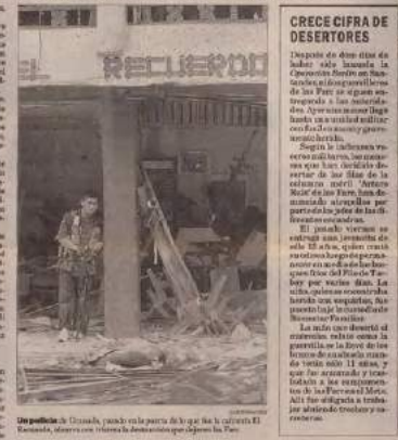
Un policía de Granada, suceso en la parte de la zona de Cisneros. El atentado, muestra un estado de desolación que dejó la zona.

Los militares murieron en el ataque a los barrios de Cisneros. Los heridos fueron trasladados a Bogotá.