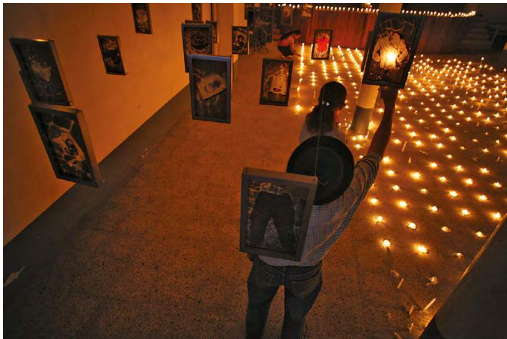
Figura 6. Río abajo (2009), de Erika Diettes, Cocorná, Antioquia.

cado en el periódico. A pesar de que las imágenes de violencia siempre han estado presentes en los medios masivos de comunicación, este era diferente. Era un inventario del horror confrontándonos a todos. Algo terrible, pero real (Diettes, 2015a, pp. 165-166). 42