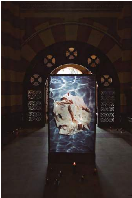
Figura 7. Río abajo (2014), de Erika Diettes, Iglesia de Las Nieves, Bogotá.

Al caminar de manera ondulante por la instalación de las imágenes, 46 cuya escala es proporcional a la de un cuerpo humano, la luz se filtra por los vidrios impresos de manera resplandeciente. Si en los municipios los formatos pequeños fueron iluminados con velas, en las otras exhibiciones la iluminación también se hizo presente en forma de vitral (figura 7). Si bien por su forma las imágenes pueden asemejarse a un ataúd —la dimensión y el marco de la fotografía—, esta