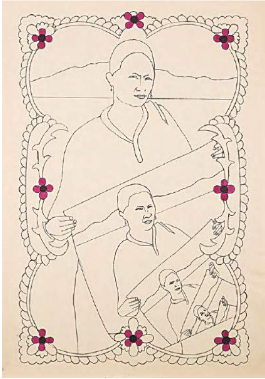
Figura 4. Ondas de rancho grande (2008), de Beatriz González.

interés de la artista por el aporte iconográfico que las imágenes de la reportería gráfica podían ofrecerle. (2016). 37