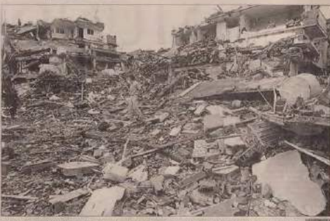
Del impacto del atentado de Granada (Antioquia) después de la explosión, se puede observar el estado de las ruinas por parte de las Farc.

La policía indicó que los guerrilleros se retiraron de la zona.