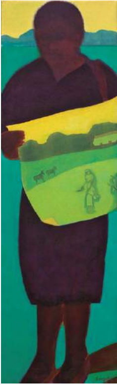
Figura 5. Cuadro de la serie Carta furtiva (2009), de Beatriz González.