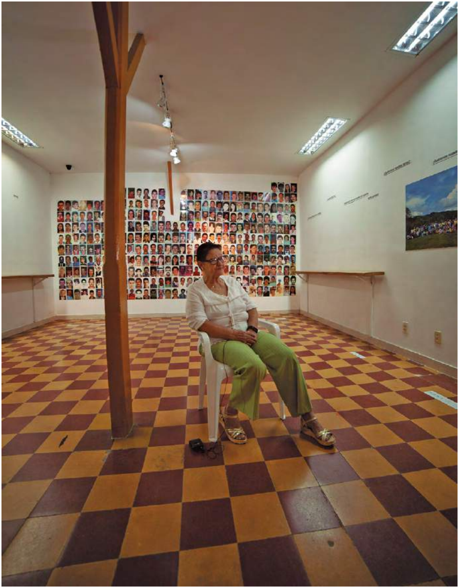
Figura 1. Panorámica del primer piso del Salón del Nunca Más, Granada, Antioquia.