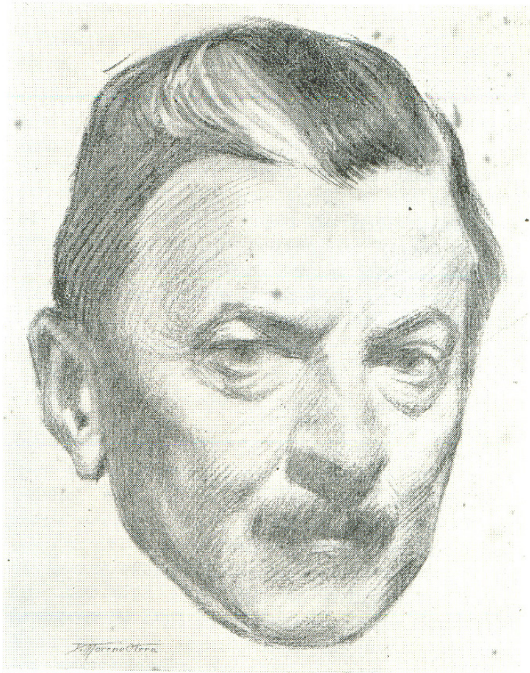
El poeta DIEGO URIBE. * 1867 + 1921 (Dibujo de Moreno Otero).