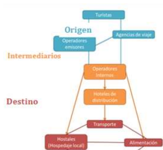
Gráfico 4: Cadena de Valor Turística

De esta manera la cadena de valor se encuentra estructurada así: