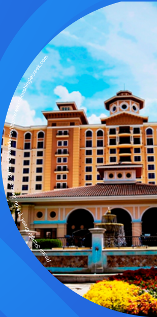
2015) Obtenido de http://www.complejohistoric.com