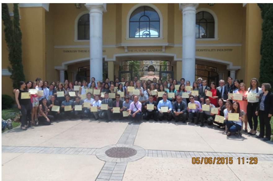
IX Seminario Internacional en Gestión de las Organizaciones, Facultad de Ciencias Administrativas Universidad de Bogotá Jorge Tadeo Lozano