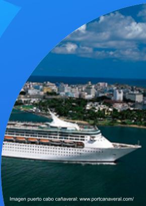
Imagen puerto cabo cañaveral: www.portcañaveral.com/

Los Puertos Cabo Cañaveral y Puerto Santa Marta, son activos logísticos estratégicos y motores de desarrollo económico internacional de Estados Unidos y Colombia. Su dinámica económica y empresarial guarda una relación directa con el nivel de desarrollo de ambos países.