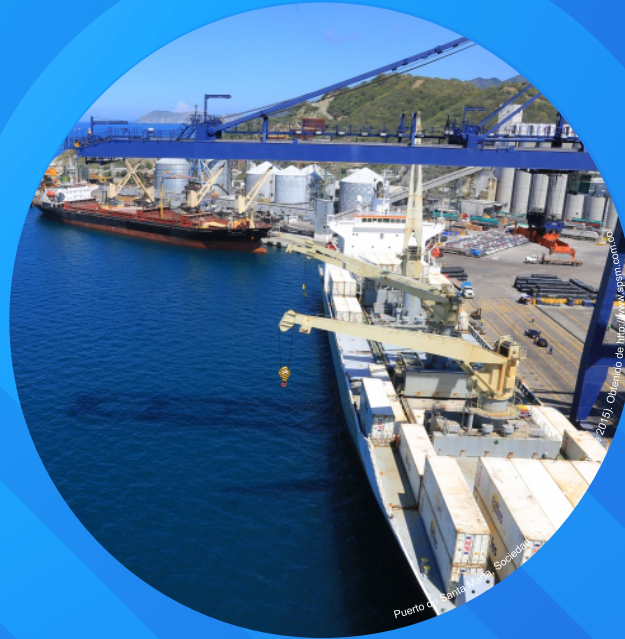
Puerto de Santa Marta Sociedad