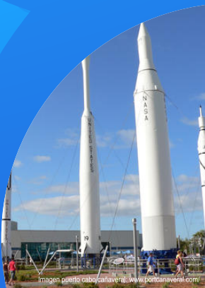
Imagen puerto cabo cañaveral. www.portcañaveral.com/