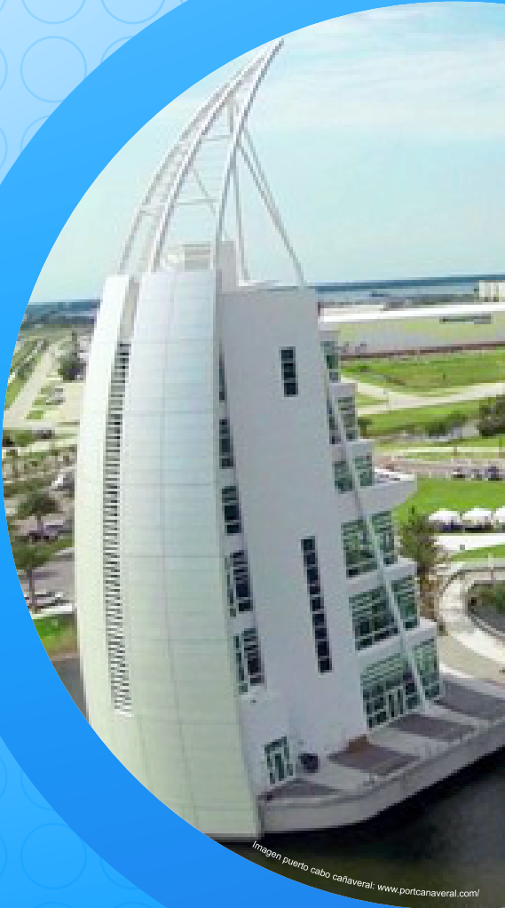
Imagen puerto cabo cañaveral

transferirlo al cliente final, impactando de manera positiva en ese momento de verdad, mostrando coherencia entre palabras y gestos, estando conscientes de lo que están escuchando de boca del cliente y atesorarlo para convertirlo en obras.