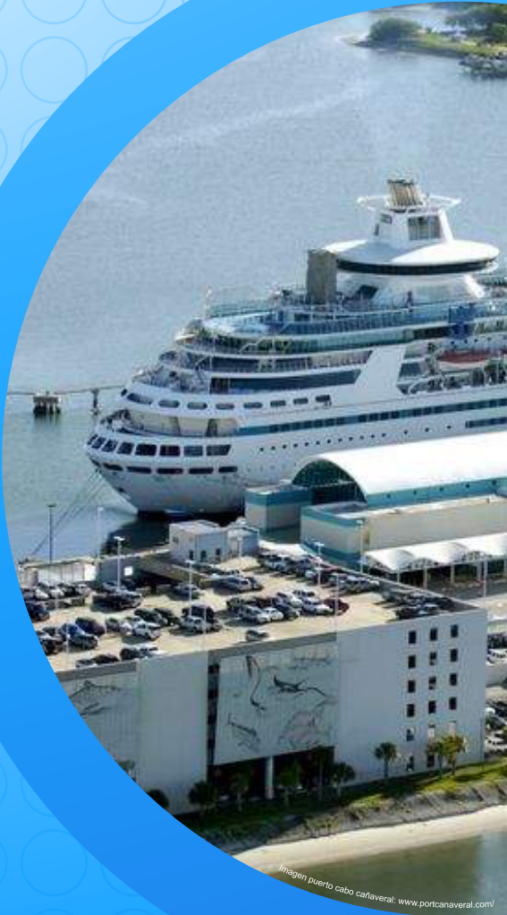
Imagen puerto cabo cañaveral: www.portcañaveral.com/