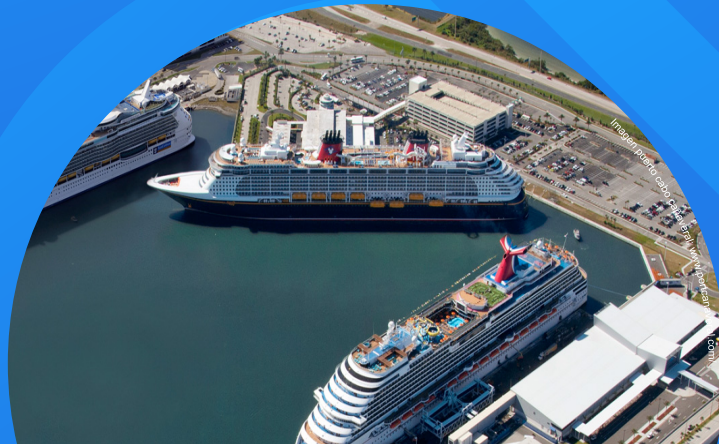
Imagen puerto cabo