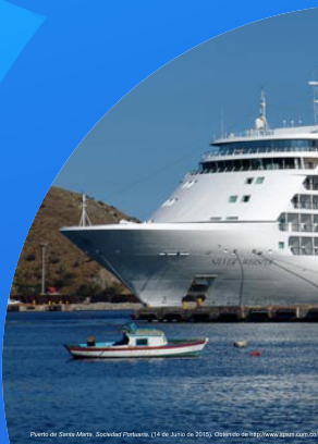
Puerto de Santa Marta, Sociedad Portuaria, (14 de Junio de 2010). Obtenido de http://www.aport.com.co/

En el caso colombiano, los puertos de los océanos Atlántico y Pacífico nutren el país, no solo de mercancías sino también de visitantes en busca de placer, de experiencias, e irónicamente se observa como cada vez se aprecian más las cosas básicas, que es uno de los potenciales que tiene Colombia, donde las tradiciones indígenas y afrocolombianas entretejen desde mochilas cada una con una historia única y especial, pasando por una variada gastronomía, hasta un macondiano