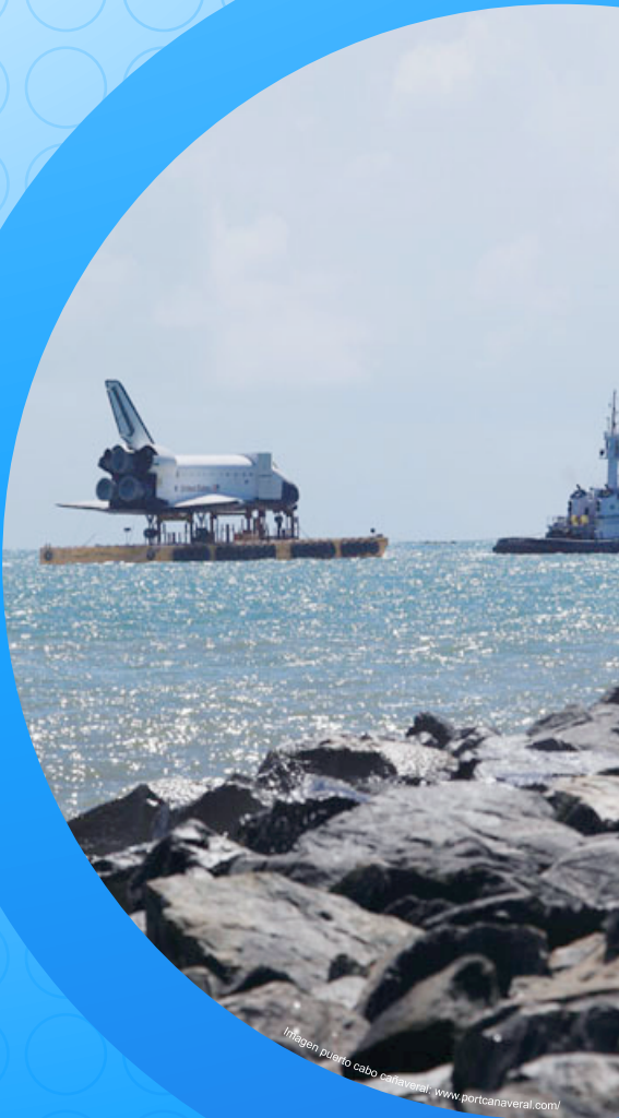
Imagen puerto cabo cañaveral. www.portcañaveral.com/

Se proyecta a mediano plazo, reestructurar terminales adicionales, para que recalen cruceros de mayor capacidad, dado el crecimiento constante, experimentado en el Puerto. Dentro de la planeación, también se incluyen modificaciones estructurales en cuanto a canales de ingreso, que se limita a uno solo en el momento, con miras a la apertura del canal de Panamá, previendo un aumento en la demanda. Una de las