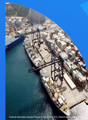
Puerto de Santa Marta, Sociedad Portuaria. (14 de Junio de 2015). Obtenido de http://www.sppm.com.co/