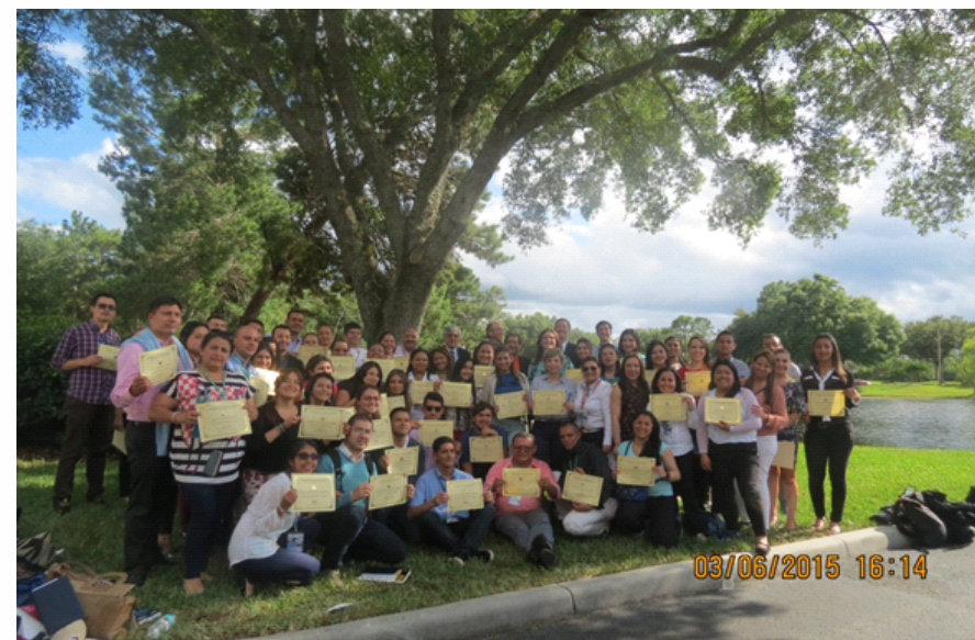
IX Seminario Internacional en Gestión de las Organizaciones, Facultad de Ciencias Administrativas Universidad de Bogotá Jorge Tadeo Lozano