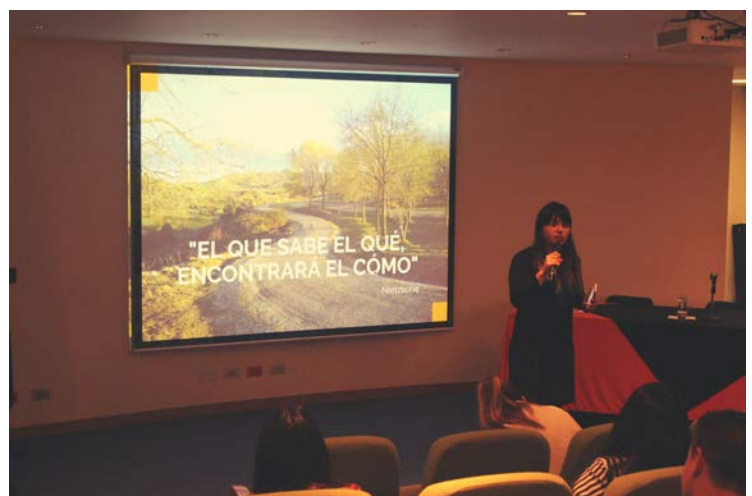
Taller Hoja de Vida, Universidad San Buenaventura, octubre 2017