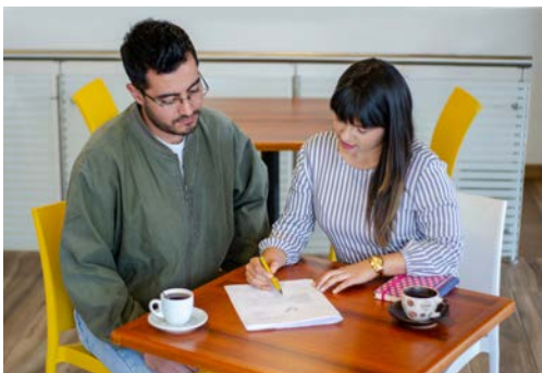
Más de 100 asesorías en Perfil y Hoja de vida