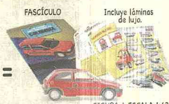
FIGURA A ESCALA 1:43