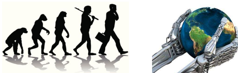
(1) Avance de la tecnología

Existen muchas posiciones sobre cuál ha sido el mayor avance de la humanidad, algunos dirán que los sistemas filosóficos han transformado nuestra manera de entender el mundo, otros propondrán que fueron las religiones las que han cambiado las civilizaciones e influido en la forma de vivir de las personas; no, son los imperios los que han hecho avanzar la humanidad, o las exploraciones, los avances de las matemáticas, los periodos de florecimiento de la ciencia y el arte, o ...en fin, el debate puede continuar sin una conclusión definitiva. Pero, si nos apoyamos en los datos estadísticos sobre desarrollo social (comunicaciones, transporte, forma de vida, población mundial, etc.), nada de lo dicho anteriormente ha sido significativo. Indiscutiblemente un concepto le dio un giro de 180° a la historia de la humanidad: la tecnología .